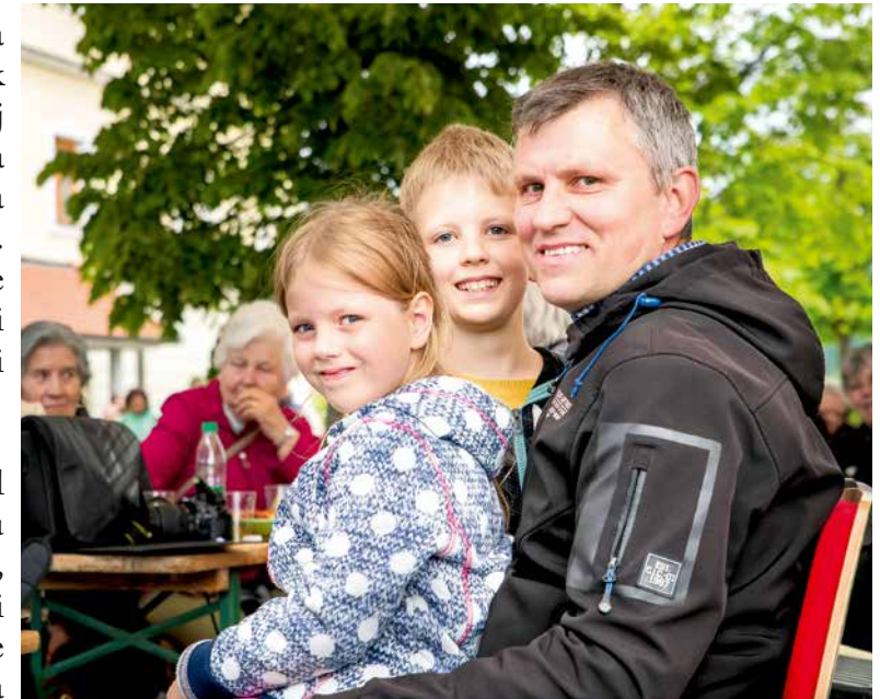
Dan odprtih vrat Doma je praznik, ko se v hvaležnosti za poslanstvo veselimo tako ustanovitelj kot družine zaposlenih