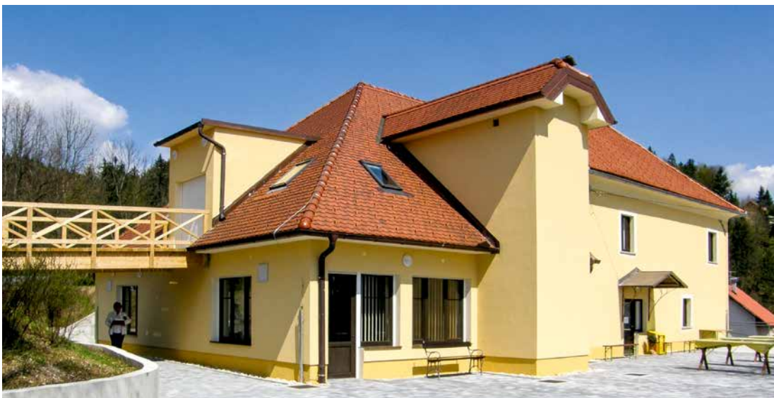
Dom Bratstva na Zaplani vabi nove obiskovalce

Zahodno od Vrhnike leži vas Zaplana, razprostrta po gričih in hribih. Leži na nadmorski višini 664 metrov. Krščansko bratstvo bolnikov in invalidov je to leta 1998 prevzelo v dolgoletni najem in upravljanje staro župnišče. Počasi so ga začeli obnavljati, predvsem z denarnimi darovi in prostovoljnimi delom članov in dobrotnikov. Dograditev doma in večja prenovitvena dela so bila zaključena leta 2008.