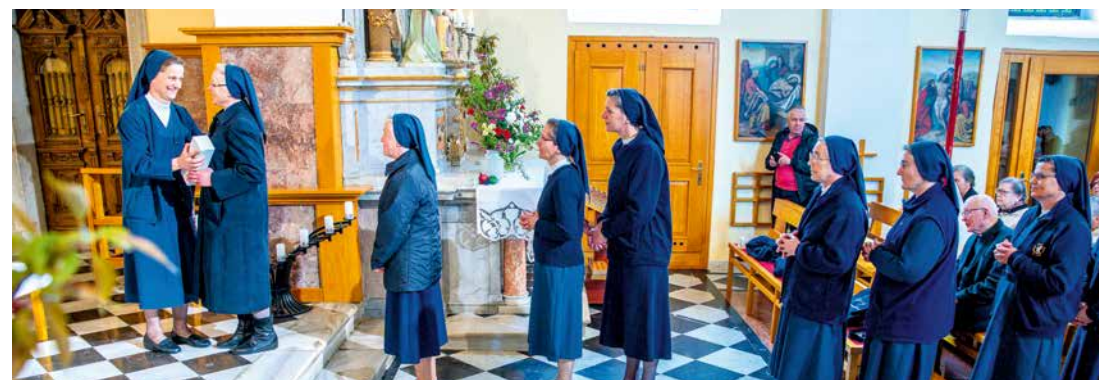
Podelitev jubilejnih sveč predstavnicam skupnosti Slovenske province in Albanske pokrajine

provinci 1243 sester. Le malo jih je odšlo, nekoliko več, ko so se zaradi izrednih razmer leta 1948 razkropile k domačim ali drugim sorodnikom in jih je spremenjen način življenja odnesel nekoliko stran od poklica – v večini primerov pa ne stran od Kristusa. Tista prva, temeljna odločitev zanj je ostala.