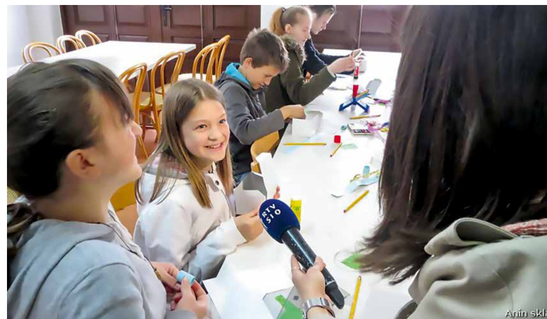
Otroci so veselo ustvarjali na delavnicah

Predavanju je sledilo prijetno srečanje. Uprava se zahvaljuje vsem, ki so sodelovali in pomagali, da je srečanje uspelo. V prvi vrsti sestram usmiljenkam, sestram drugih skupnosti in vsem družinam, ki so prišle ter dragim dobrotnikom, da srečanja omogočajo. Ob sklepu so vse povabili, da ob sredah molijo za družine in dobrotnike Aninega sklada, ki že 21 let podpirajo družine z več otroki. ■