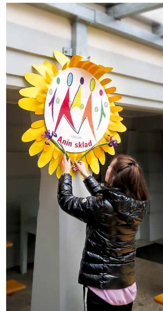
V ustanovo Anin sklad je vključenih okrog 200 družin

Ustanova Anin sklad si prizadeva, da bi se več staršev odločalo za tretjega in četrtega otroka, da bi bile številčnejše družine v družbi bolj razumljene, da bi se med seboj spoznavale in se podpirale, da bi se pospeševal pozitiven odnos do zdravega družinskega življenja in da bi bilo javno »ozračje« naklonjeno družinskim vrednotam. ■