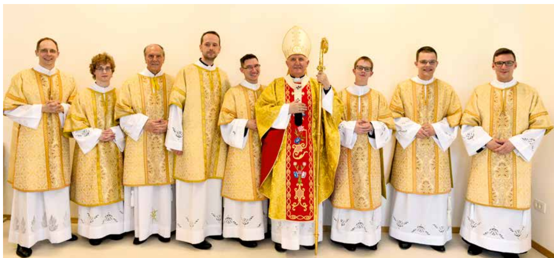
Novoposvečeni diakoni s škofom posvečevalcem