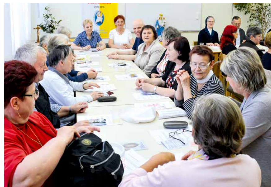
Molilci se veselijo molitvenega druženja, še bolj pa prejetih milosti

Najlepše uslišanje smo doživeli pred kratkim, ko nas je babica male deklice iz neverne družine prosila za molitev, ko je hudo bolna 3. letnica čakala na