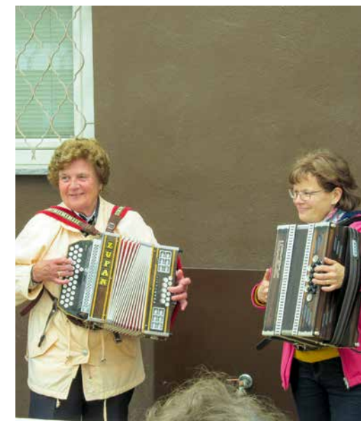
Veselite se na pikniku