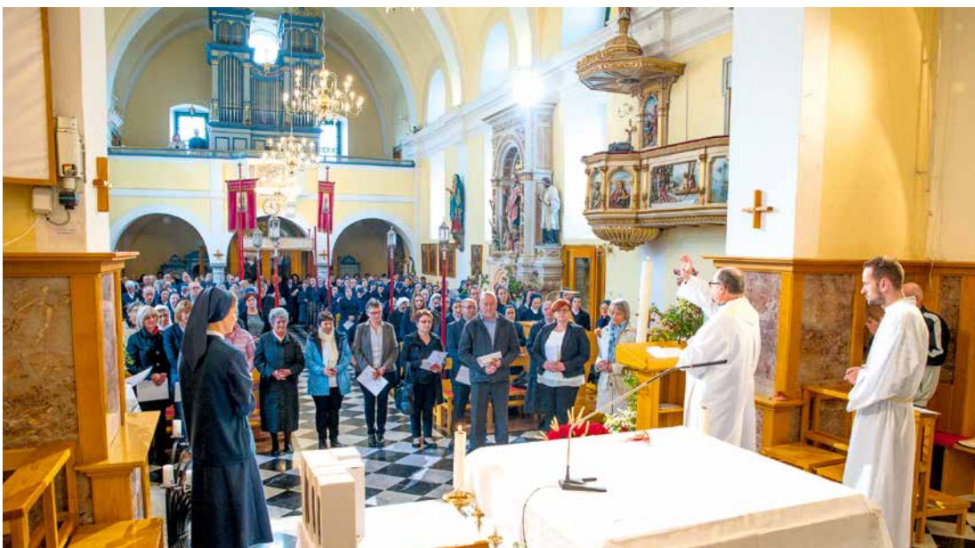
Sprejem med pridružene članice in člane