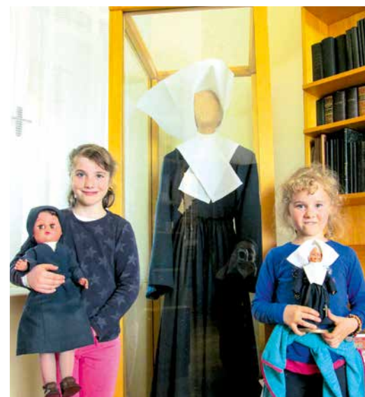
V spominski sobi graške provincialne hiše

Po kosilu, ki so nam ga pripravili v sestrskem domu duhovnih vaj in prijazno postregli, smo se razdelili