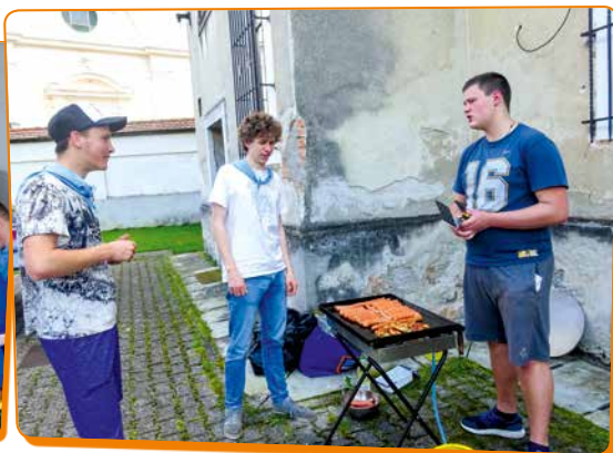
Mmm, diši :)