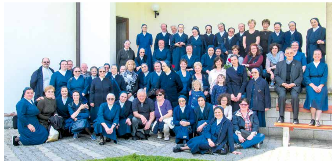
Romarji na dvorišču provincialne hiše

Kjer je lepo, čas hitro teče. Tudi nam je. Tako je prišla ura, ko se je bilo treba podati na pot proti domu. V hvaležnosti za lepo preživet dan, tudi vreme nam je bilo naklonjeno, smo se Bogu zahvaljevali z molitvijo Večne devetdnevnice na čast Brezmadežni in večernicami. Spremljale so nas tudi besede matere Brandis, ki nam jih je prebirala ena od sester. Naj omenim samo en citat, ki naj nas spremlja na naših poteh: » O Bog, ki si zase me ustvaril, samó pri tebi danes naj ostanem. Nič naj ne moti mi duhá, usliši klice mojega srca!«