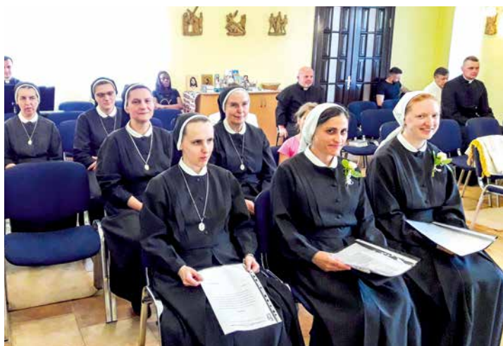
Marijine sestre so se veselile redovne preobleke in zaobljub sester v Ukrajini