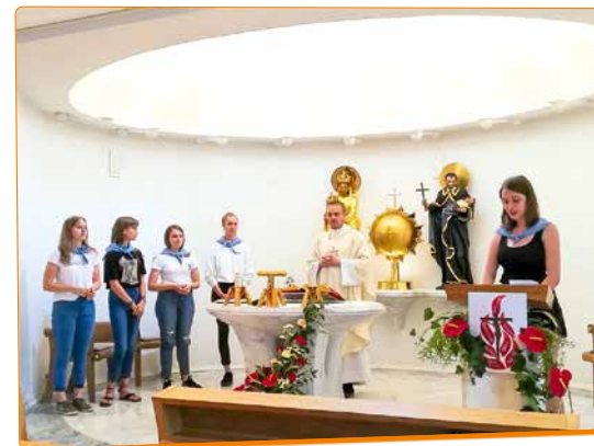
Dobili smo nove članice