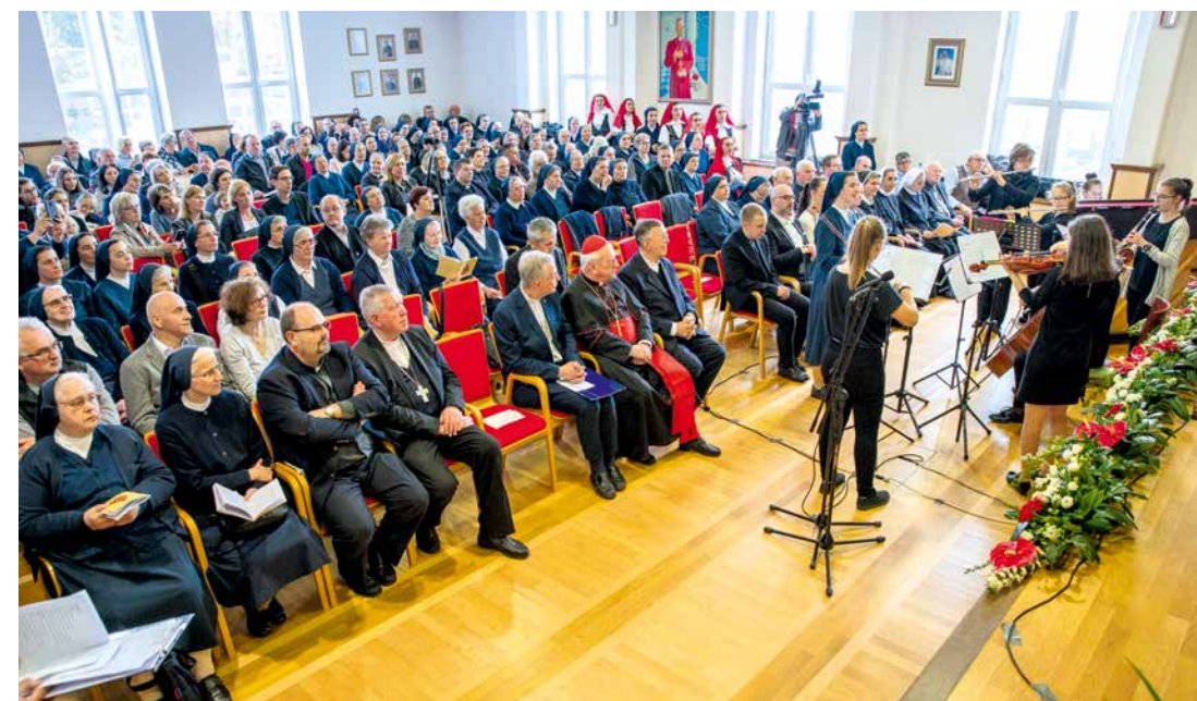
Mladi instrumentalisti med slavnostno akademijo