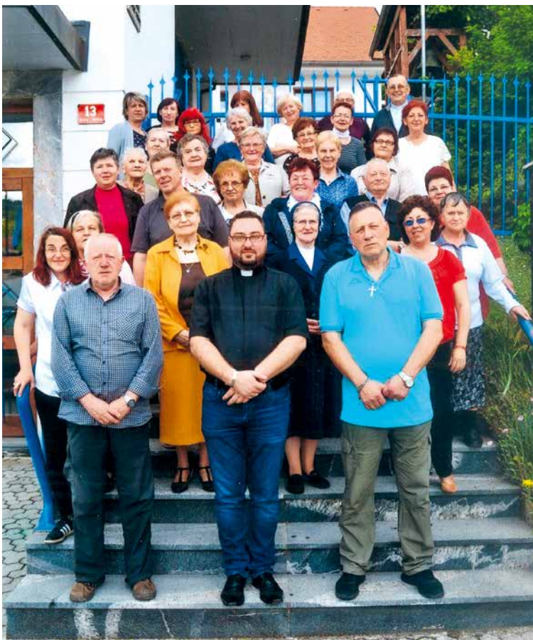
Goreči molilci iz Trbovelj

Z velikim zaupanjem se ji zato v prošnjah, ki jih ni malo, na vsakem srečanju priporočamo in jo prosimo za pomoč. Čutimo njeno navzočnost predvsem pri povezanosti nas, članov Združenja