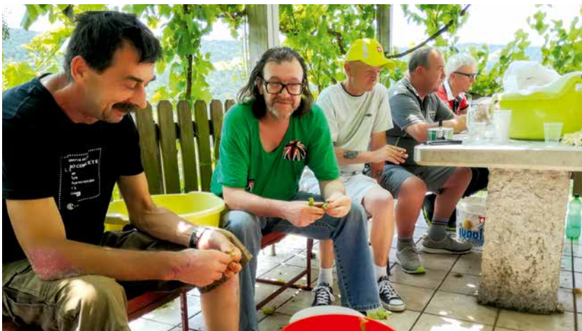
Pomoč pri različnih gospodinskih opravilih

V Dnevnom centru za brezdomce v Ljubljani vsak dan poteka vrsta dejavnosti, s katerimi pomagamo brezdomnim vračati veselje do dela, ustvarjanja in življenja. Kot nadgradnja dejavnosti v Ljubljani pa že nekaj let poteka socialna rehabilitacija oziroma »sredine delovne akcije na Mirenskem Gradu«. V zadnjem letu postajajo stalnica in tako se vsaj trikrat na mesec odpravimo iz Ljubljane na Mirenski Grad. V povprečju se prijavi okrog 7 brezdomcev, ki se tudi sicer redno udeležujejo aktivnosti v Dnevnom centru. Skupino vedno spremlja vsaj eden od zaposlenih.