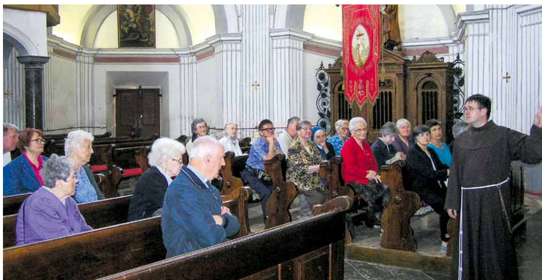
Udeleženci duhovne obnove so prisluhnili razlagi zgodovine svetišča