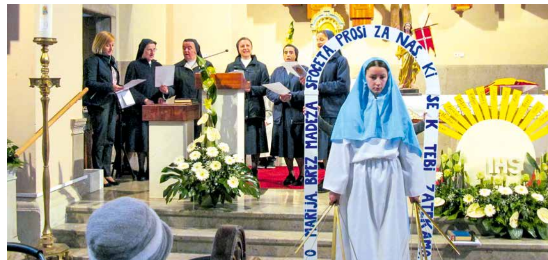
Predstavitve Marijine svetinje

Popoldanska ura nas je opominjala, da bo treba srečanje počasi zaključiti, kajti udeležence je čakala pot domov. Zapeli smo Angelček, varuh moj ..., dobili blagoslov g. ravnatelja, zaželeli srečno pot drug drugemu. Veselje srca bomo drugim še naprej oznanjali.