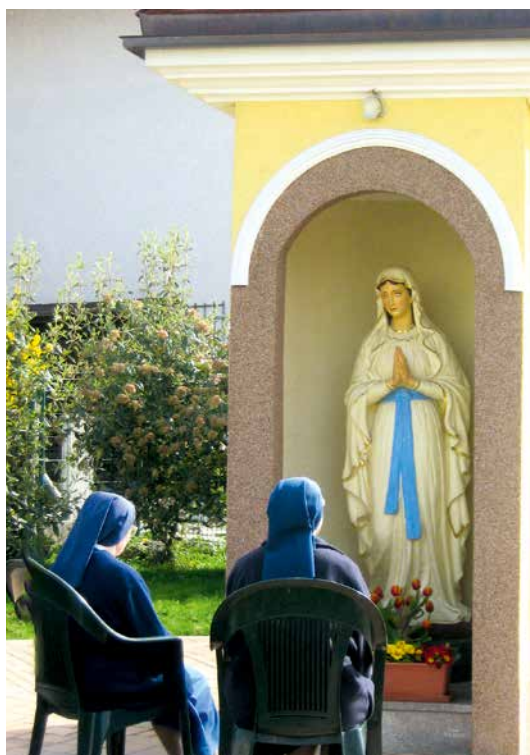
Sestre usmiljenke se večkrat priporočajo Mariji v varstvo

In vendar vse to ni dovolj, da mlad človek posveti življenje Bogu, po Kristusu in v njem. Priti mora izrecen Božji klic, ki ga človek sprejme in se scela odloči zanj. Tu ne gre za izbiro: malo da, malo ne, kot bi radi živeli nekateri današnji mladi, ko se ne želijo odločati za poroko in vendar imeti pravice družine; ali ločeni, ki želijo prejemati obhajilo, a še naprej živeti v neurejenem razmerju. Ko gre za podaritev Kristusu, gre za vse ali nič. On in nihče drug. Ali kot so včasih rekly izkušene sestre: Bog in nič naokrog! Da, Jezus na prvem mestu, vse drugo mu je podrejeno. In te naše sestre, ki so se tako množično odločale za služenje ubogim, so popolno podaritev vzele zares. Vedele so: od doma odidem za vedno, ne da bi svoje mogla še kdaj obiskati, čaka me zahtevno življenje odpovedi in trdega dela pri bolnikih ali kje drugje, ko bo zaradi utrujenosti še moliti težko. Za vse bo potrebno dovoljenje, razvedrila ne bo drugega kot v krogu sestrskе družine ali na kakšnem izletu v naravo. Vendar se niso ustrašile – za Kristusa vse. Malo pred drugo svetovno vojno je bilo v Jugoslovanski