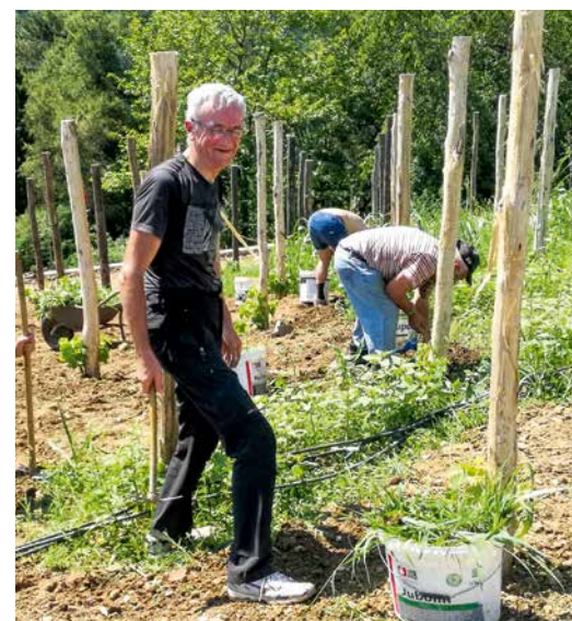
Vključevanje v delovne akcije pomaga brezdomnim narediti korak naprej v življenje

V zadnjem mesecu smo delovno akcijo dvakrat podaljšali do četrta in smo na Gradu prespali. To je bilo posebno doživetje. Večer smo popestrili z družabnimi igrami, spali smo v lepih sobah, zbudili smo se v čudovito mirno jutro brez ljubljanskega hrupa in za nameček smo že pred zajtrkom obirali jagode.