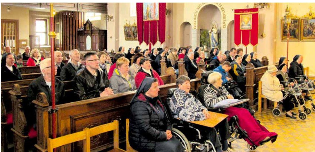
Leopoldinin piknik se je pričel s sv. mašo