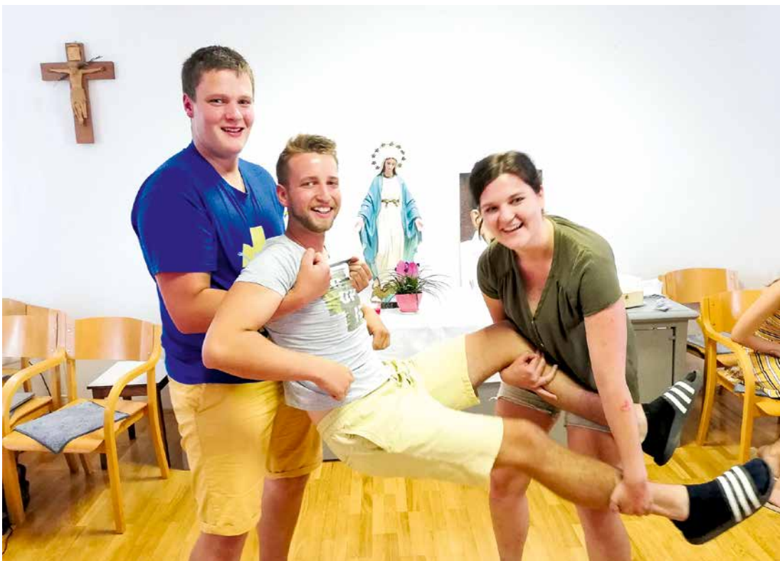
V MVM-ju veliko moči posvečajo delu z mladino