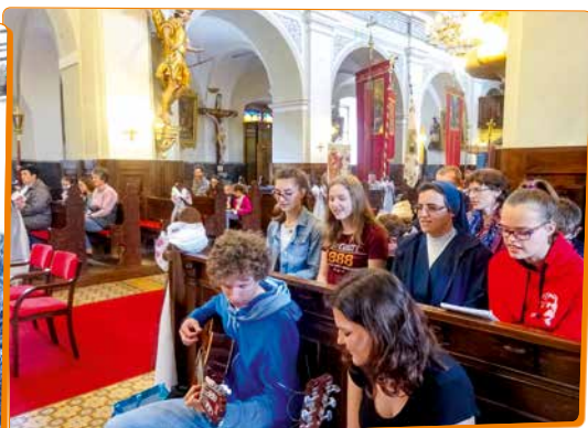
Kjer sta dva ali so trije zbrani...