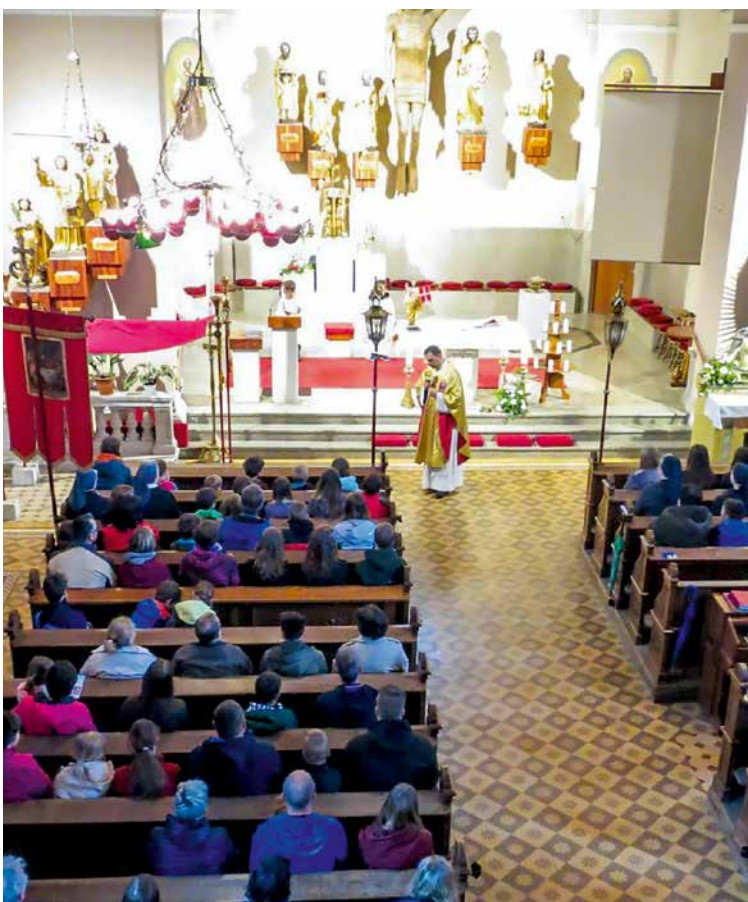
Srečanje družin Aninega sklada v Šentjakobu ob Savi

N a god svetega Florjana, zavetnika gasilcev, je v Šentjakobu ob Savi potekalo tradicionalno srečanje Ustanove Anin sklad, ki podpira družine z več otroki. Več kot 170 otrok iz skoraj 45 družin ni zmotilo slabo vreme za prihod na srečanje, ki je nosilo naslov »Otroci so dar«. Zbrane je med sveto