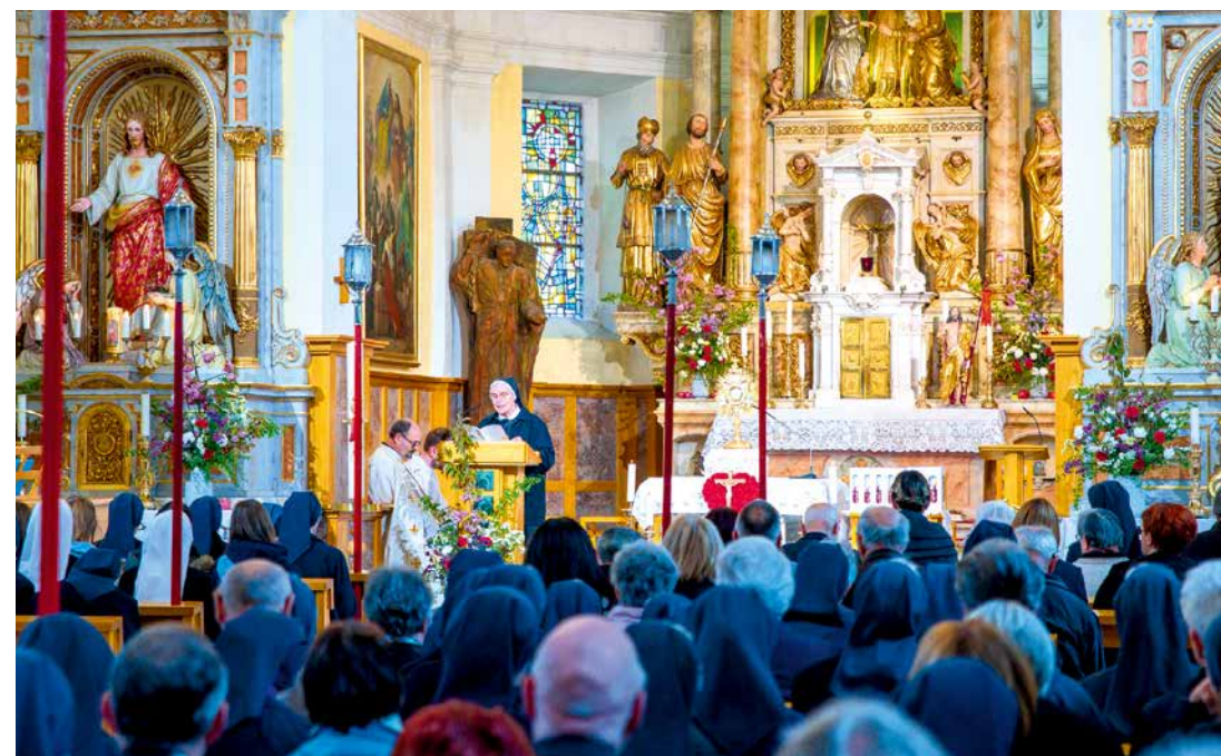
Uvodna molitev v cerkvi