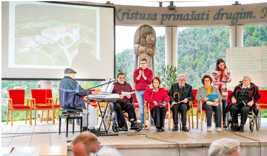
Tudi predstavniki varstva starejših našega Doma so pripravili vsebinsko in nadvse zabaven predstavitevni program

Z vselitvijo prve stanovalke 20. 5. 2008 se je za Dom sv. Jožef začela pisati zgodovina še zadnje, najmlajše dejavnosti Varstva starejših. Na ta dan tradicionalno pripravljamo dan odprtih vrat, kjer se srečujemo stanovalci, njihovi bližnji, zaposleni z družinami, župljani in lazaristi.