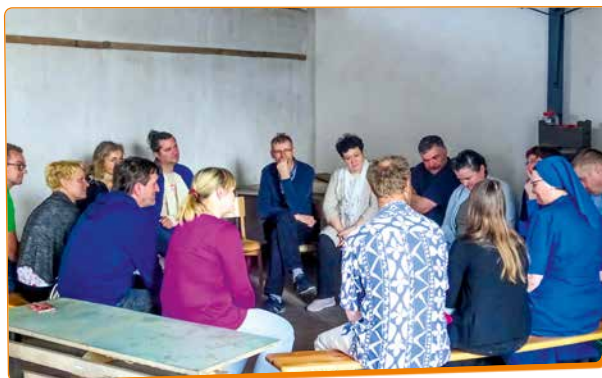
Krog s starši