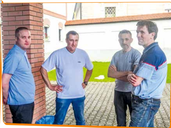
Dež bo :)