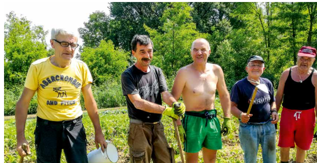
Delovne akcije ob sredah na Mirenskem Gradu predstavljajo socialno rehabilitacijo

Brezdomni se na akcijah dobro počutijo. Ponosni so, da lahko naredijo nekaj dobrega. Pri delu so vestni, odgovorni in zavzeti. Veliko jim pomeni domačnost in topel sprejem vseh na Gradu. Veseli so tudi dobrih