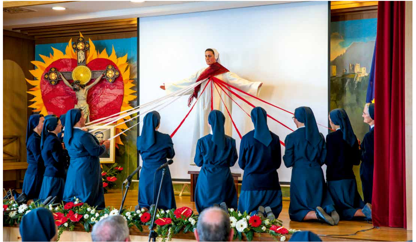
Prizorček sester Albanske pokrajine: Usmiljeni Jezus in usmiljenka