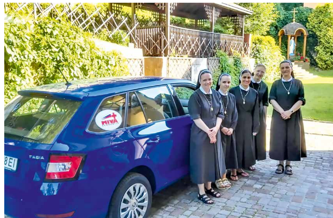
Misijonski avto pomaga Marijinim sestram v Kijevu, da lahko služijo mnogim bratom in sestram

Zelo lepi spomini nas vežejo na javni prevoz po Kijevu. Predvsem zaradi ljudi in dogodkov, ki jih je tako skrbno vodila Božja previdnost. Prav zanimivo je tudi, da smo avto dobile v sredo dopoldan. Sredini popoldnevi pa so namenjeni našim obiskom brezdomcev v Prenočišču, kamor smo do sedaj hodile dobre pol ure peš. Podnevi je še šlo, vračanje v temi domov pa ni bilo nič kaj prijetno. Naša prva