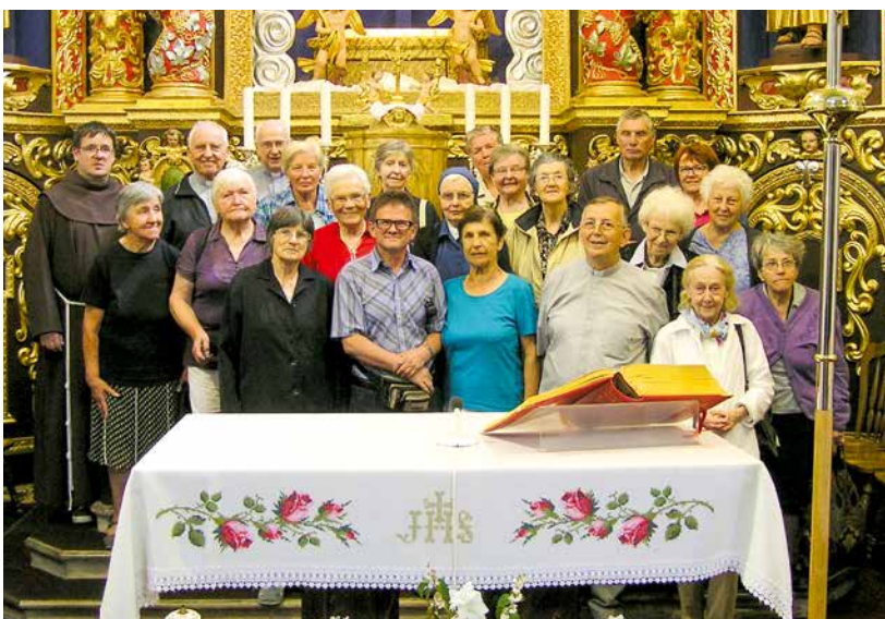
Člani Vincencijeve družine so se zbrali na duhovni obnovi v Novi Štifi na Dolenjskem