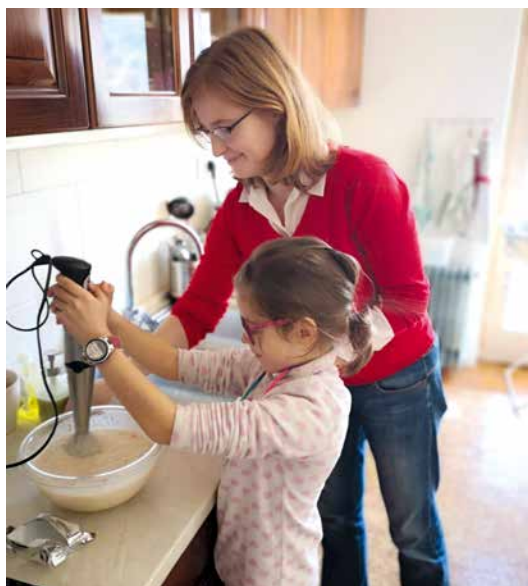
Kar otroci sami skuhamo, jim še bolj tekne

Opravila, ki so se jih lotevali, so bila zelo raznolika. Skrbeli so za Marijin dom, v katerem potekajo vse dejavnosti centra. Pometali so hodnike, čistili stranišča, brisali prah in pospravljali. Nad delom niso bili vedno navdušeni, čeprav so morali priznati, da se je lepše učiti in igrati v čistih in urejenih prostorih. Bolj kot čiščenje jim je dišalo kuhanje. Pripravljali so mlečne malice, ki so jih skupaj z ostalimi otroki po učni pomoči pojedli še z večjim veseljem, ker so jih skuhalo sami. Radi so tudi zalivali rože po sobah in hodnikih. Sprva so si predstavljali, da gre pri tem le za sprehod po hiši, pri čemer se lahko še malo igrajo z vodo, kmalu pa so spoznali,