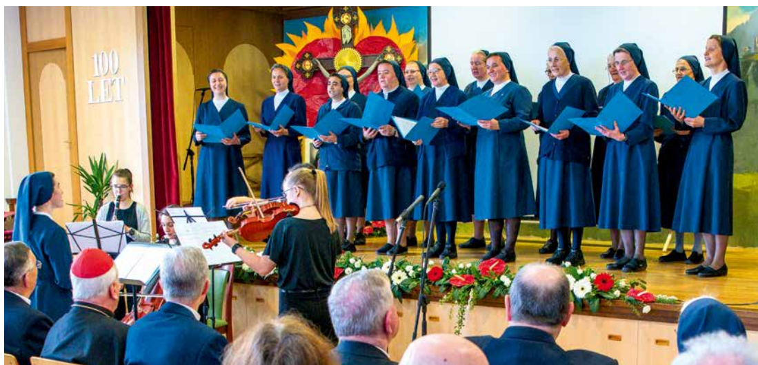
Zborček sester zapoje himno stoletnice