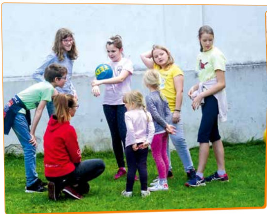
Biti mora nekaj zanimivega