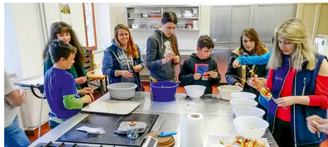
V dobri družbi otroci razvijajo zdrav odnos do dela in življenja

Še poseben izziv so otrokom predstavljala opravila, od katerih vsaj na prvi pogled sami niso imeli nobene koristi. Tako so npr. za glasbeno skupino urejali note. "Zakaj moramo mi to početi? Zakaj si tega ne pospravijo sami," so bila vprašanja, ki so sprožila pogovor o tem, da je lepo pomagati drugim