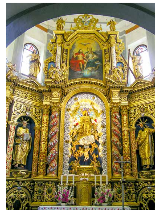
Oltar v cerkvi Marije Vnebovzete v Novi Štifi

Kakšno pa je naše srce? To je središče, ki ga more preiskovati in spoznavati samo Božji Duh. Je kraj odločanja, kraj resnice, kjer izbiramo življenje in smrt, je kraj zaveze z Bogom. Se tega zavedamo? Srce je kraj