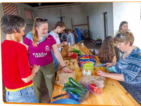
Kaj bi brez pridnih rok