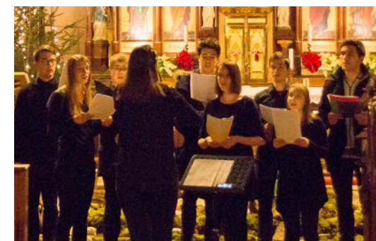
Na božičnem koncertu v Študentskem domu Vincencij je zapel domski pevski zbor.