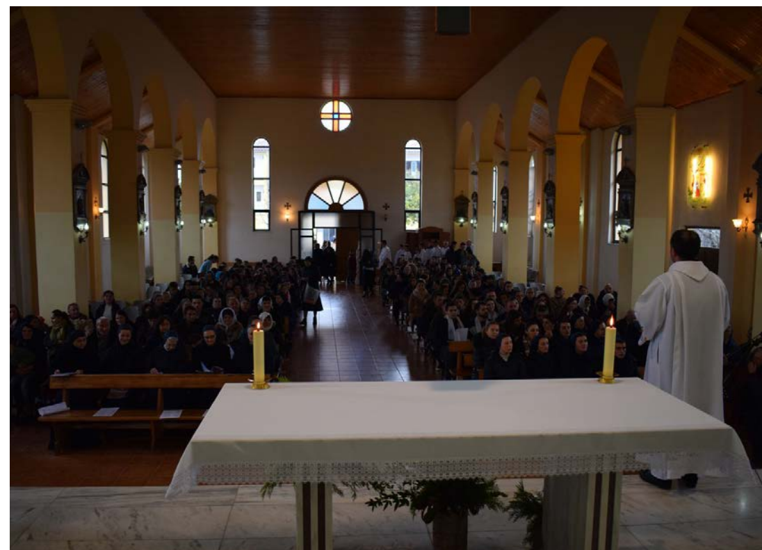
Zbiranje k sveti maši v cerkvi v Grudi.