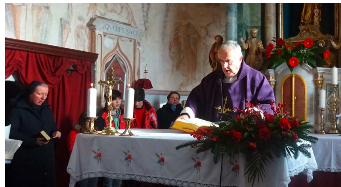
... smo prepevali pri maši, ...