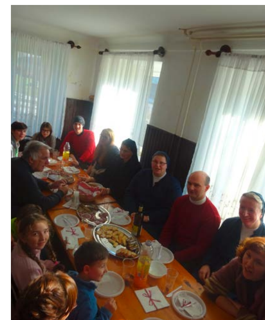
... in uživali gostoljubnost tamkajšnjih ljudi.