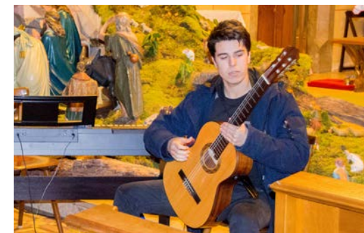
Glasbeno nadarjeni študenti so bili pripravljeni svoje talente deliti in nastopiti na koncertu.

v vsej svoji veličini poskrbele, da nam je zastal dih. Po koncertu smo se še malo družili ob hrani in pijači. Bila sem hvaležna za ta večer, za vse nastopajoče, ki so bili pripravljeni deliti svoje talente z drugimi, najbolj pa sem hvaležna seveda vsem, ki so k organizaciji prispevali levji delež, saj brez njih tega pobega v praznično vzdušje ne bi bilo, in upam, da bom lahko tudi naslednje leto del tega doživetja. ■