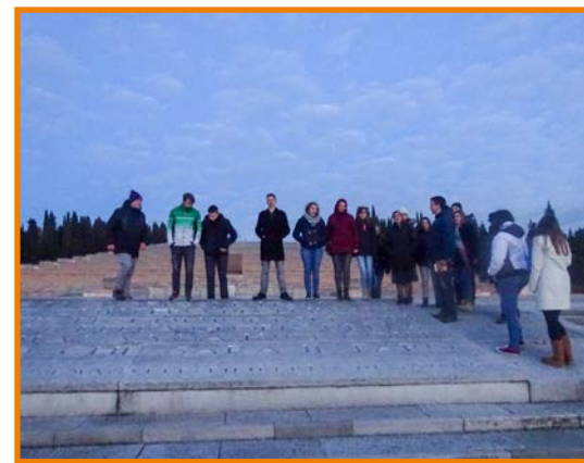
Še skupinska fotografija na zadnjem postanku v Italiji.