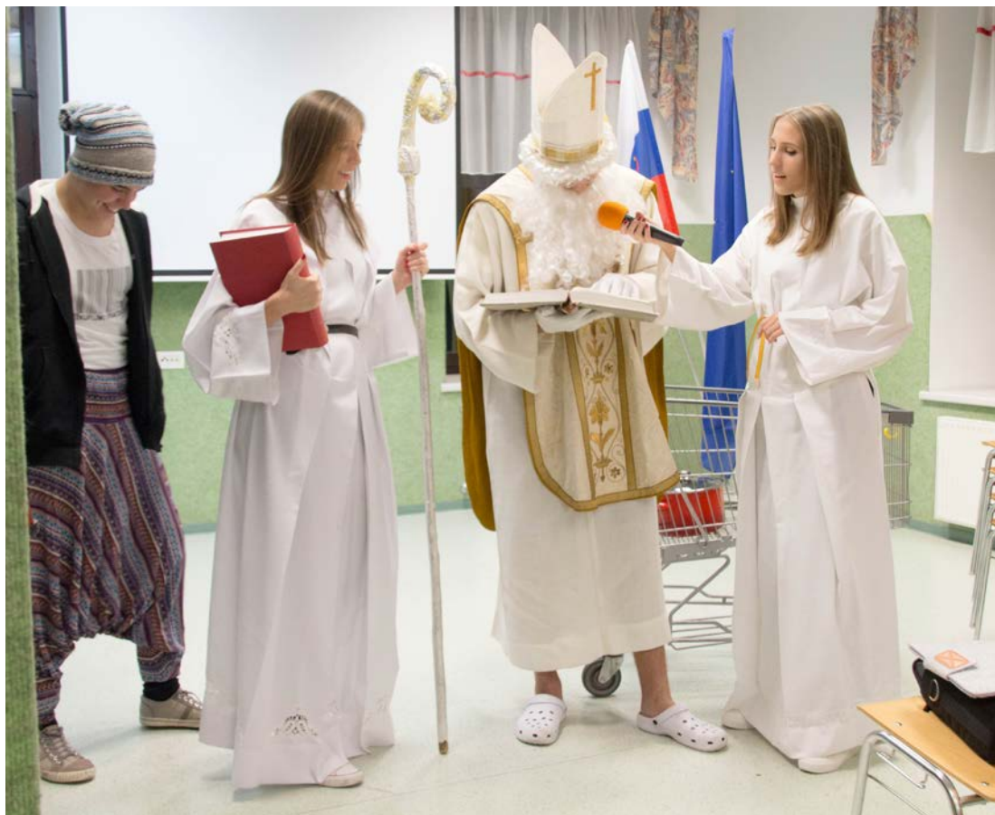
Tudi študenti ŠDV-ja so nestrpno pričakovali sv. Miklavža.

Menim, da je najbolj značilen dogodek ŠDV-ja prav prvi v akademskem letu. Če kolikor toliko poznate naš dom, morda kakšnega »domovca«, veste, da je moral prestati domsko brucovanje, če je želel pri nas ostati dlje časa. Verjamem, da čeprav je vsak domski bruc po svoje doživljal tiste zgodnje jutranje ure, pa vseeno ne