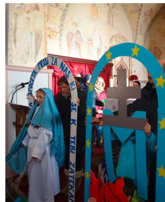
... predstavili svetinjo ...

Ko smo prišli čez trojanske predore, smo padli spet v meglo, ampak smo po tako lepem in bogatem dnevu svetili mi. ■