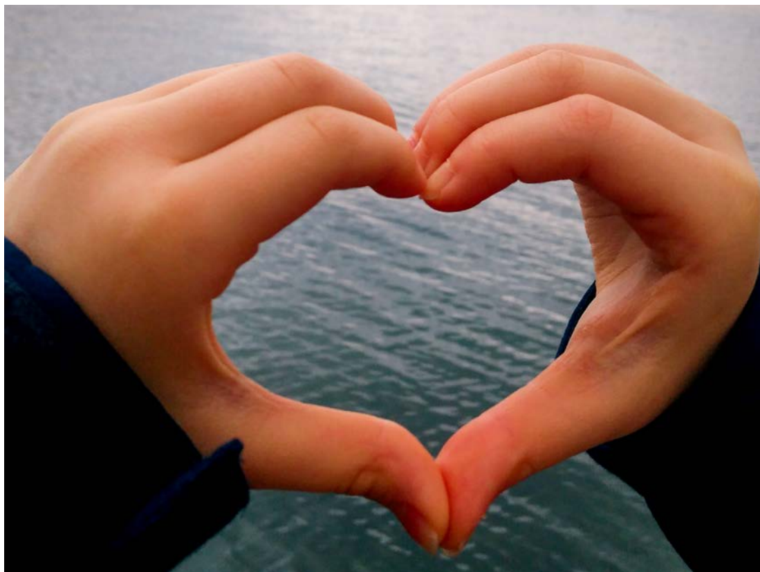
Vsaka družina je še kako pomembna kariera za našo državo v prihodnosti.

Seveda, to so bili načrti, kot jih ima danes veliko mladih, potem pa se je zgodilo. Mama pri 18. letih, no ja, seveda je