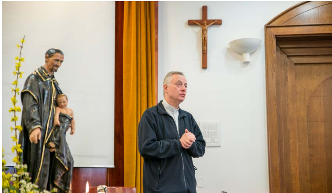
»Štirideset dni z Jezusom v puščavi naj obnovi in poglobi naš odnos do Marije, naše nebeške Matere.«

Spodbudite ustanovitev kake nove skupine Združenja čudodelne svetinje v vaši župniji z dovoljenjem župnika, v bolnišnicah in dispanzerjih, v šolah in na univerzah z