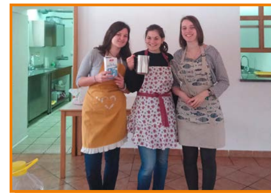
Krive za dobro hrano.