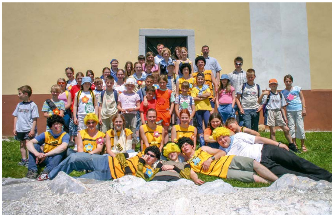
Izlet leta 2005 na Gradišče.

Najdaljša korenina sega v leto 1830. Marijanska vincencijanska mladina je edino združenje mladih, ki je nastalo na