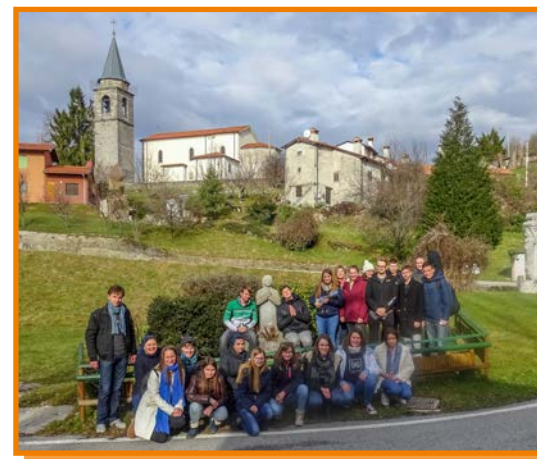
Naša prva skupinska fotografija na romanju.

Izlet je bil zanimiv in poučen. Družba MVM-jevcev je odlična. ■