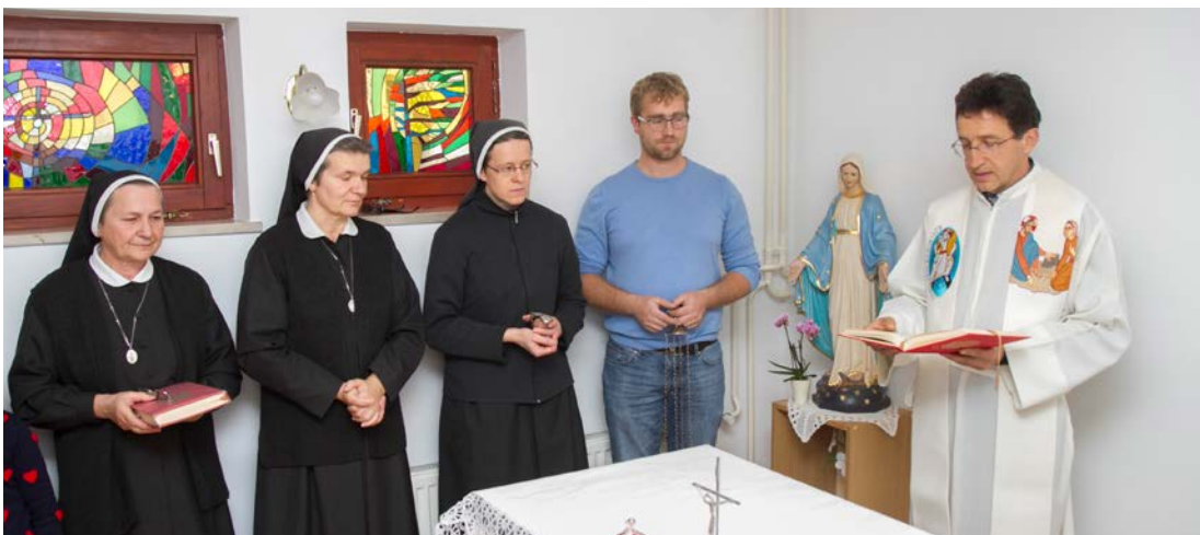
Z blagoslovom obnovljene hiše v Celju Marijine sestre ponovno prihajajo služiti bolnim in ostarelim.