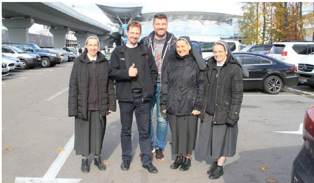
Jezus se danes poslužuje sester redovnic, da lahko pride v mesta in vasi, kamor je sam nameraval priti.

Komaj smo stopili z letališča, je že sledilo fotografiranje, po poti klepet, po sv. maši in kosilu pa se je začelo že čisto zares.