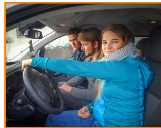
Ekipa, ki nas je varno vodila skozi dan.