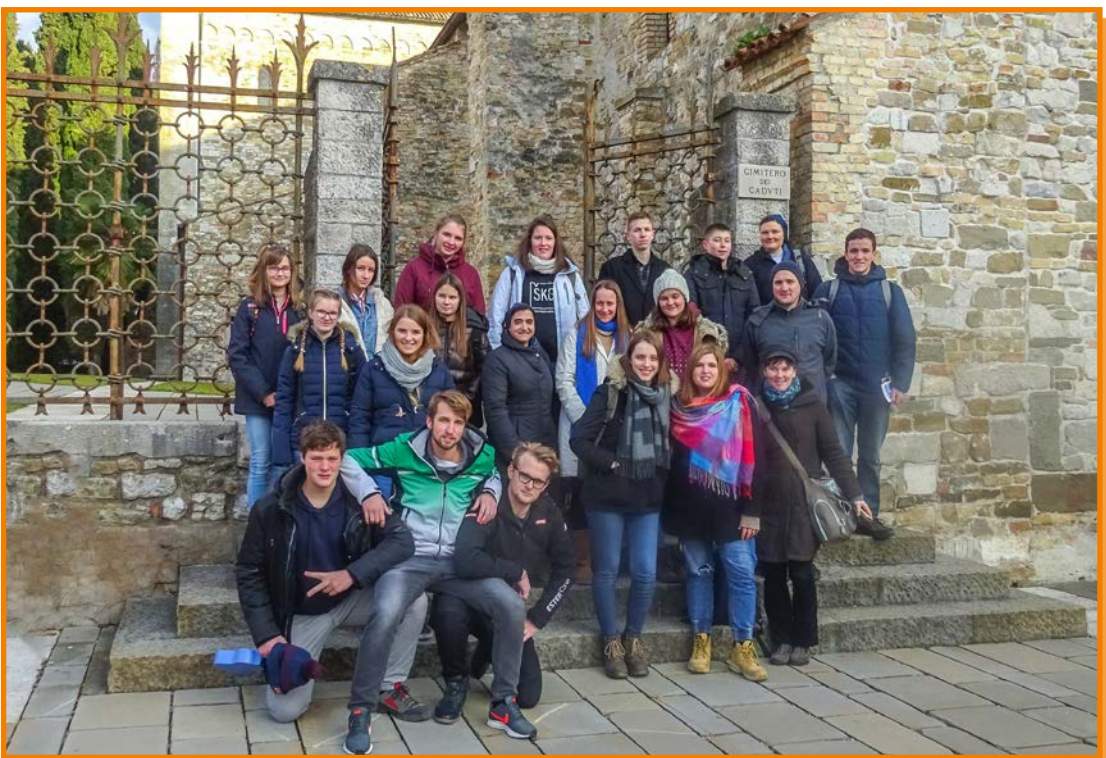
Skupaj smo si ogledali tudi Oglej.

Pred mašo, ki je sledila takoj po prihodu, nam je domači župnik razložil zgodbo male Terezije. Ker je govoril italijansko, nam je priskrbel prevajalca. Po maši smo si ogledali zanimiv kip Terezike, kapelico in kot zanimivost nam je vodič razkazal še dom za romarje. – Po malici smo šli v Oglej. V mestu so na ogled ostanki rimskega foruma, najdbe rimskih stanovanjskih objektov z ohranjenimi mozaiki. V Ogleju smo si ogledali znamenito cerkev in izvedeli nekaj o njeni zgodovini. Po ogledu cerkve smo