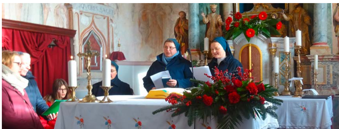
V prelepem kraju in cerkvi...