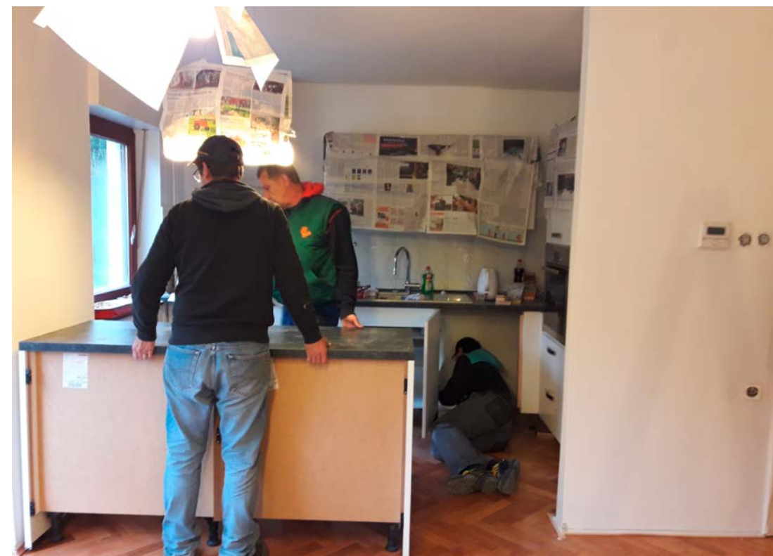
Novo postojanko Marijinih sester je v celoti obnovila ekipa članov Društva prostovoljcev Vincencijeve zveze dobrote.