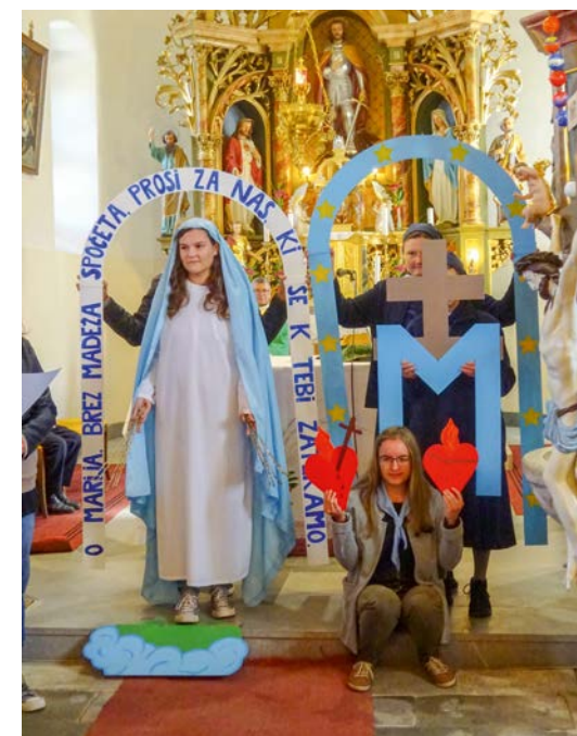
MVM je nastala po Marijini želji.

Danes je druženje v zdravem okolju zlata vredno in človeku omogoča boljšo duhovno rast. Pri MVM je to prisotno, poleg duhovne plati pa je pri nas prisotna tudi fizična pomoč ubogim. Vsem je najbrž jasno, da ko nekemu pomagaš, ima ta oseba nekaj od tega, vendar dokler nisi sam udeležen pri prostovoljni pomoči, ne ugotoviš, da tudi sam pridobiš ogromen delež veselja in zadovoljstva. Vse to ponuja MVM. Sam osebno se trudim, da kažem zgled tako udeležencem dogodkov kot tudi tistem, ki dogodke soorganizirajo, saj če vi stremimo k temu, potem bo naša družba osebno močno zrasla.