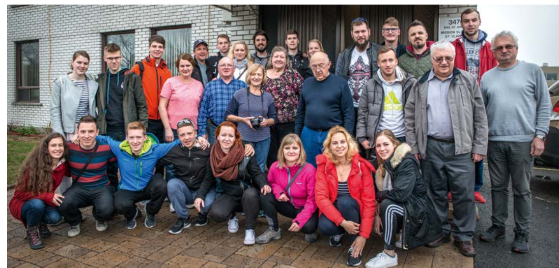
Hvala Bogu, tudi po mladih, ki izhajajo iz okolja, prežetega z Vincencijevim duhom, žari bolj kot si včasih mislimo, njegova karizma. To potrjuje tudi obisk mladine Sv. Jožefa med našimi izseljenci.