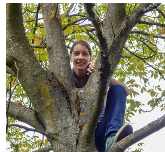
Skavti se čutijo domače še posebej v naravi.

Toliko iz mojega življenja. Verjetno nisem ravno »tradicionalen« katoličan, kaj hitro me ujezi petje ljudskih pesmi z vsaj tonom previsoko ali prenizko intonacijo, hitro izgubim živce, ko kdo prehitro drdra molitev rožnega venca in nikakor se ne strinjam s trditvijo, da all starke ne spadajo k mašni obleki ... Še vedno pa vidim Boga v majhnih stvareh, še vedno me zmeraj znova preseneča in navdušuje. Vedno znova se ga trudim iskati in poslušati in vedno znova me usmerja na pravo pot, kljub moji precejšnji trmi. ■