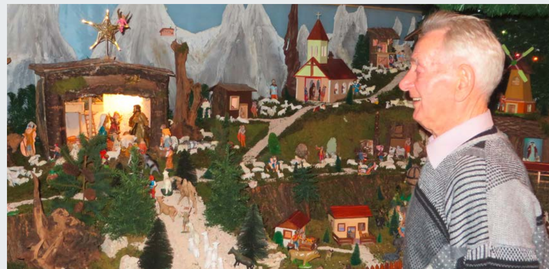
Matija Balažic postavlja iz leta v leto večje jaslice.

Čeprav mi prostor omogoča, da bi jaslice lahko ostale postavljene vse leto, jih vendar vsako leto postavljam na novo. Čar božiča je namreč v tem, da se s postavljanjem jaslic pripravimo na božične praznike. Običajno jih začnem postavljati že po 10. decembru. Pri pripravah mi pomagajo otroci in vnuki, ti mi tudi naberejo mah. Ko postavljam jaslice, izgubim občutek za čas, saj me delo tako veseli in posrka vase, da sploh ne gledam na uro. Potem se pa nenadoma zgrozim, ko je ura že ob dveh ponoči. V božičnem času grem vsak večer pred počitkom pred jaslice in tam molim. Kar ne morem se ločiti od njih, tako me prevzamejo. Jaslice si radi pridejo ogledat naši sosede, prijatelji in tudi kakšna veroučna skupina. ■