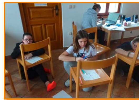
Kakšen je moj dan?

ljudi je ravno prav (v celem vikendu se lahko z vsakim pogovarjaš)