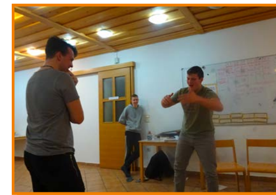
Le kaj bi to pomenilo?

ljudi je ravno prav (v celem vikendu se lahko z vsakim pogovarjaš)