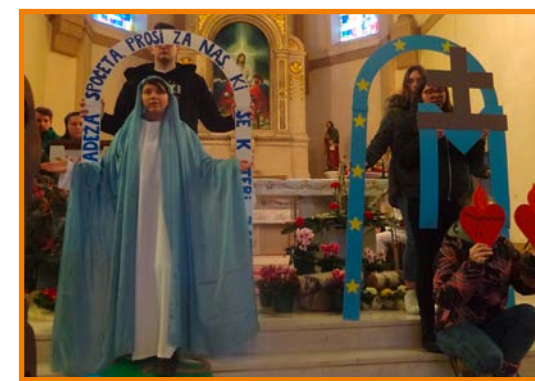
V župniji smo predstavili svetinjo.