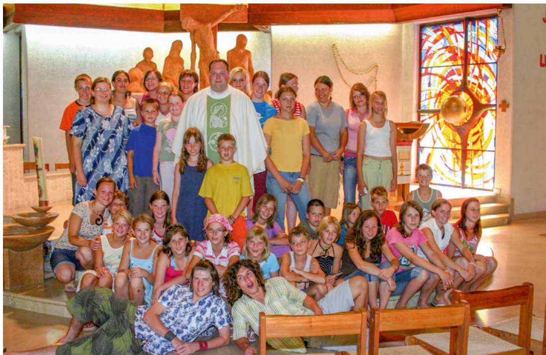
Letovanje v Portorožu leta 2007.