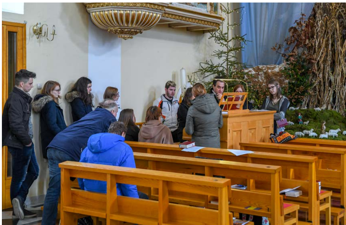
Na orgelskem seminarju so se zbrali nadobudni organisti iz okoliških glasbenih šol ter župnij od blizu in daleč.

Praktični del nam je prinesel veliko znanja. Po kratki sramežljivosti in strahu smo