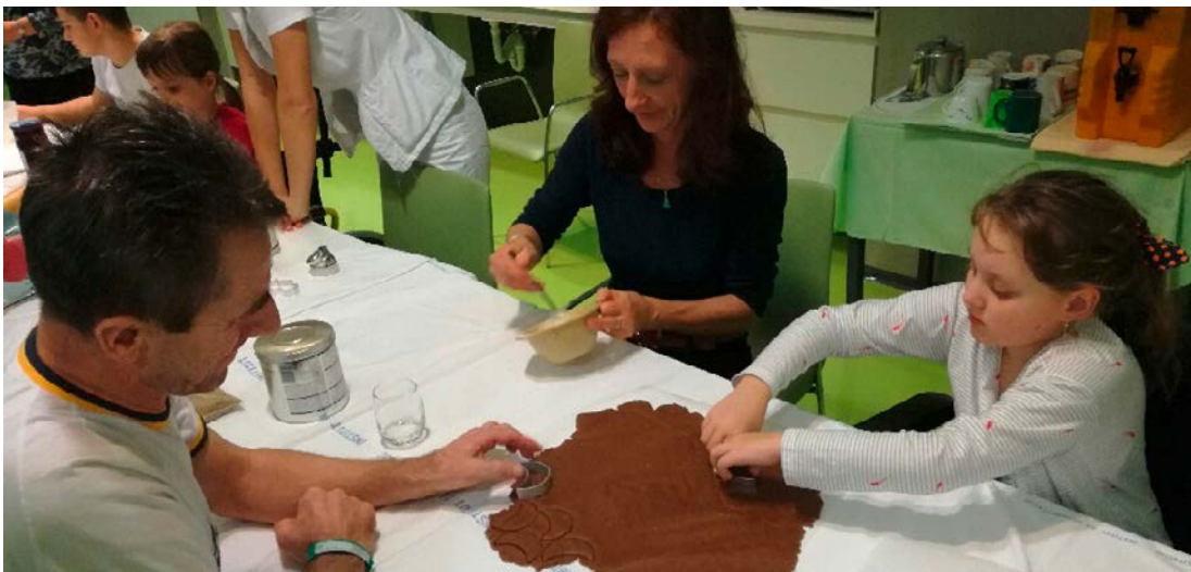
Prostovoljci VZD obiskujejo bolne otroke na Soči in skupaj z njimi ustvarjajo.

N a Univerzitetnem rehabilitacijskem inštitutu Soča nas vsak torek popoldne na otroškem oddelku pričakujejo otroci, saj je to čas, ko skupaj z njimi ustvarjamo, se pogovarjamo in igramo. Marsikateri otrok ostane na Soči več časa, zato je ta dan zanje odlična priložnost za sprostitev. Na delavnicah se imamo lepo, odkrivamo svoje talente in se veselimo lepih umetnin, ki jih ustvarjamo skupaj. Otroci jih z veseljem odnesejo domov.