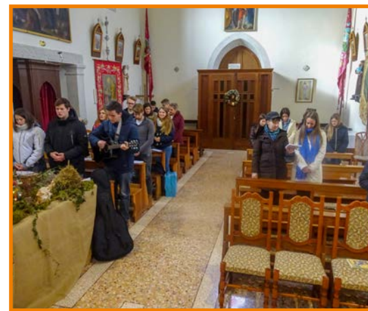
Romanje smo začeli z mašo v cerkvi.