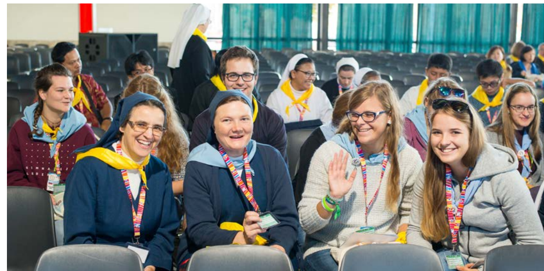
Člani MVM so bili dobro zastopani tudi ob zaključku praznovanja 400-letnice vincencijanske karizme v Rimu.

zbirali otroci in mladi z naše župnije pri sestrah ter spoznavali Marijo prek igre, pogovora in delavnic. Ne spomnim se, zakaj, vendar kar naenkrat srečanj ni bilo več. K sreči se moja pot pri MVM-ju s tem ni zaključila. Moje aktivno sodelovanje z MVM-jem se je začelo po končanem 7. razredu, ko sem dobila vabilo za letovanje v Portorožu. Nad tem letovanjem sem bila tako zelo navdušena, da je bila prva stvar, ko sem prišla domov, da sem prosila našega g. kaplana, če bi lahko tudi pri nas obudili srečanja. Skozi vsa ta leta sem rastla skupaj z MVM-jem, spoznavala nove ljudi, doživela ogromno lepih spominov in stvari. Hvaležna sem za vse ljudi, otroke, animatorje, izlete, duhovno-družabne vikende in srečanja, letovanja in romanja. Tako sem dodobra spoznala sv. Vincencija in Katarino Labouré, dva svetnika, ki sta mi v vzor in oporo. V življenju sem se srečala z marsikatero preizkušnjo in človek na mojem mestu bi verjetno že večkrat obupal, jaz pa sem vedno zaupala in verovala, da Tisti tam zgoraj že ve, kaj je najbolje zame.