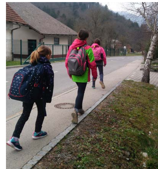
Ob vrnitvi iz šole bi vsak otrok rad mami povedal kaj lepega ali ji potožil kakšno nevšečnost.

Prav elegantno bi bilo, če bi obstajala aplikacija na pametni poti skozi življenje,