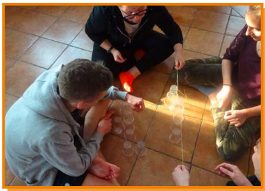
S skupnimi močmi nam bo uspelo.