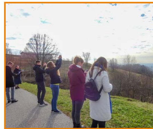
Izkoristili smo priložnost za čudovite fotografije razgleda.