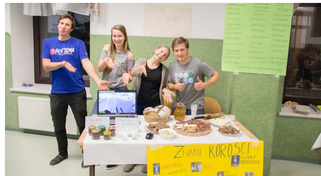
Na martinovanju so študenti pripravili pravi kulinarčni potep prek Slovenije.

more zanikati dejstva, da se je vsaj na zelo edinstven način spoznal z ostalimi stanovalci doma. Naloge, ki jih (na brucem skrivnem sestanku) preostali študentje določimo, so v prvi vrsti priložnosti za druženje in medsebojno spoznavanje.