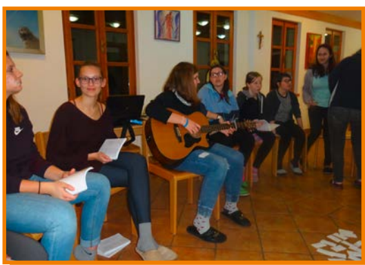
S pesmijo slavimo Gospoda.